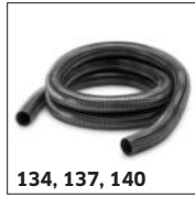
134, 137, 140