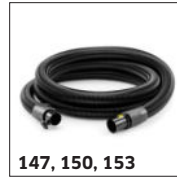
147, 150, 153