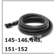
145-146, 148, 151-152