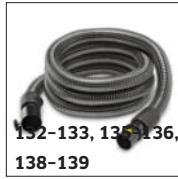
132-133, 135, 136, 138-139