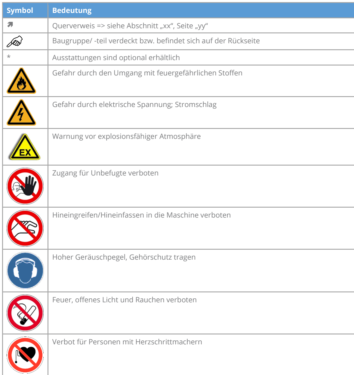
Tab. 3: Verwendete Symbole