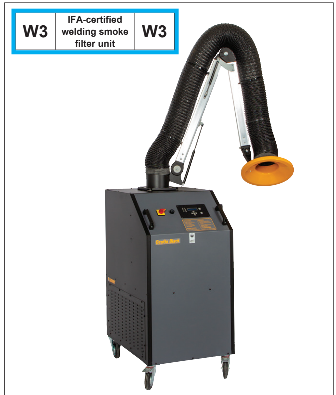
GeoGo Black W3