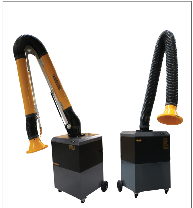
GeoGo mit ASA-4 Arm, ESA-Arm und WING-Arm