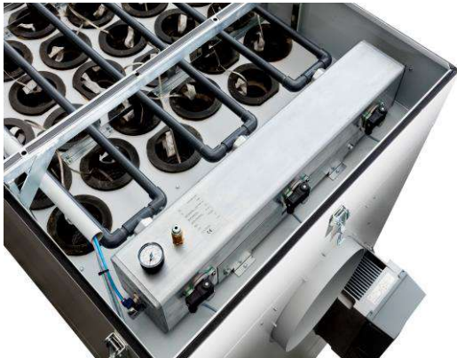
Reinluftbereich mit Filterabreinigung