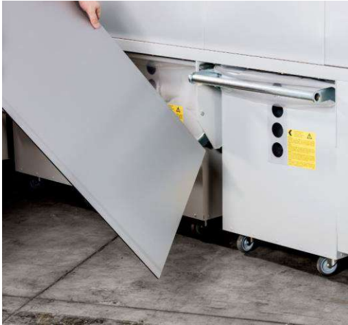
Spänecontainer mit Staubschott

Die Auslieferung erfolgt steckerfertig, nur der Spänesack muss noch eingelegt werden. Mit geringem Montageaufwand lässt sich jederzeit die Auszugsrichtung des Abfüllbehälters, links-rechts Auszug, ändern.